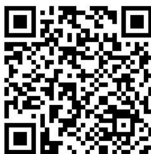
Figura 2 – QRCode do aplicativo

A Figura 2 apresenta o QRCode compartilhado através do Whats app para divulgar o produto e atrair pessoas que contribuam com sugestões para qualificar o aplicativo mobile . Entre as pessoas que inicialmente receberam o QRCode do aplicativo estão docentes do Instituto Federal Farroupilha, pessoas com deficiência e outros colaboradores do projeto.