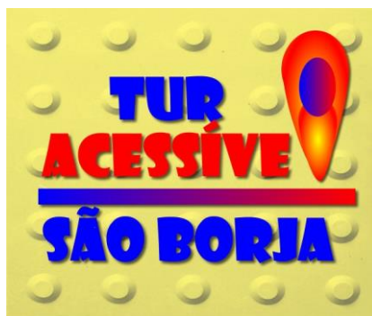
Figura 1 – identidade visual do produto

Durante o processo buscou-se construir uma identidade visual que permitisse o reconhecimento do produto através de um logotipo. A Figura 1 apresenta a identidade visual “Tur Acessível São Borja”.