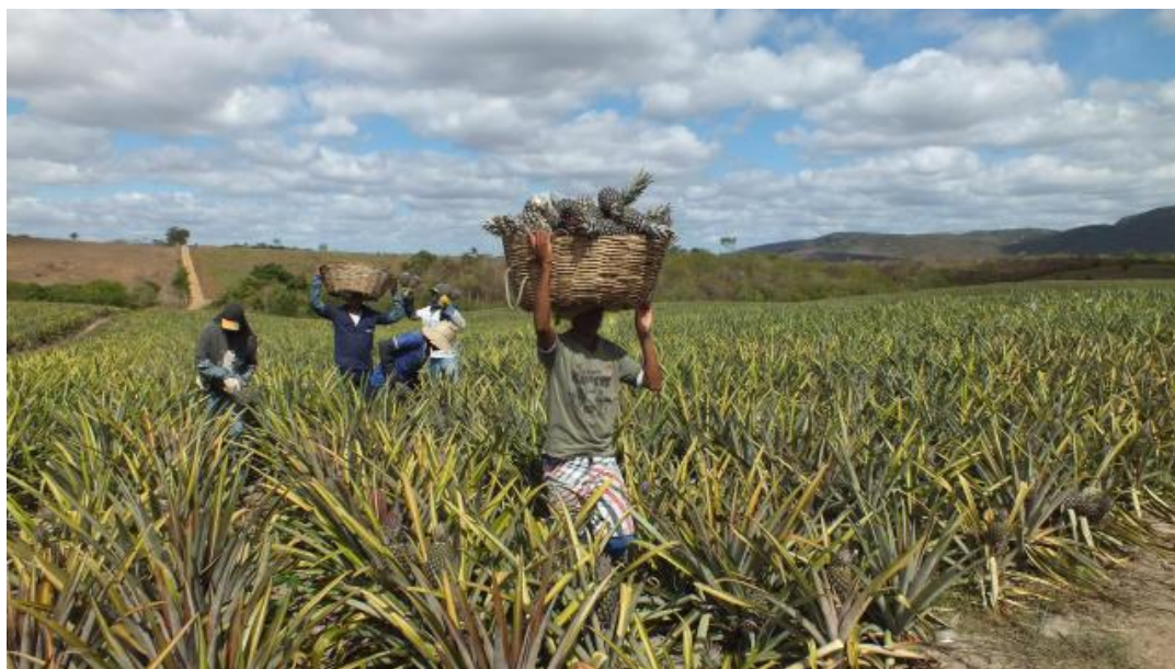
Figura 3 – Colheita de abacaxi Pérola em Itaberaba, semiárido baiano