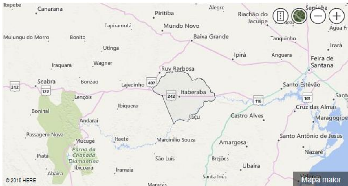
Figura 1 – Delimitação territorial de Itaberaba, Bahia