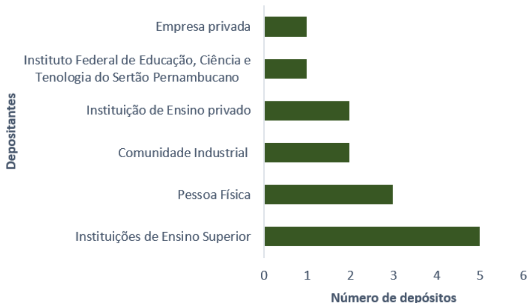
Figura 1 – Categorias de depositantes pelo INPI.